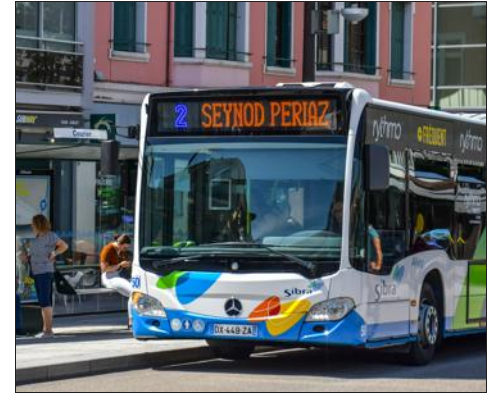
Le service de bus a été renforcé à l'occasion des fêtes de fin d'année.

À l'occasion des fêtes de fin d'année et de l'ouverture exceptionnelle de nombreux commerces, la Sibra met en place un service de bus renforcé les dimanches 8, 15 et 22 décembre. Une solution pour faciliter les achats et vivre plus sereinement les fêtes de fin d'année. Les trois lignes spéciales Noël : la ligne 3 de la gare quai nord à Gevrier ; la ligne 4 de la gare quai sud à Ponchy et la ligne 7 de la gare quai nord à Grand Épagny, plus les quatre lignes habituelles des dimanches et jours fériés.