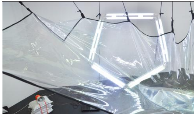
Séverin Guelpa joue avec les matériaux et les codes de la construction pour dénoncer la crise climatique.