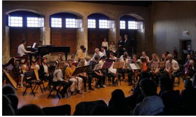
Les ensembles du Centre de pratique musicale seront en concert ce dimanche au Musée-château.

Ce dimanche 8 décembre à 18 heures, le Musée-château d'Annecy accueille les membres des ensembles du centre de pratique musicale d'Annecy. Ce concert, intitulé "Tempo d'hiver", rassemble les ensembles cordes, vents et voix de la structure, ainsi qu'un duo de pianos. Cet événement se déroule dans le cadre prestigieux du monument annécien. Le public pourra découvrir des extraits des œuvres de Vivaldi, Tosti, Verdi ou Piazzola. Entrée : 5 €, gratuit pour les moins de 18 ans. Billetterie ouverte sur le site du concert.